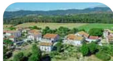
LARRAUN 916 habitantes*

Cruce estratégico entre Pamplona-Iruña, Vitoria-Gasteiz y Donostia-San Sebastián y centro de servicios (comercio, restauración, transporte, sanidad, etc.), da acceso a la vía del Plazaola, y a rincones como el Balcón de los buitres o la ermita de la Trinidad.