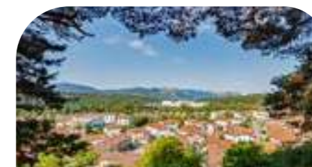
LEKUNBERRI 1.689 habitantes*

Llena de vida comercial, social y cultural, la villa cuenta con un núcleo central (casco histórico "de cine"), y caseríos diseminados rodeados de verdes montes y por la Vía Verde del Plazaola. Lugar único para disfrutar del folklore, deporte y cultura local.