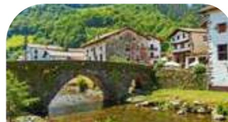
GOIZUETA 708 habitantes*

Coqueto pueblo surgido de sus cenizas (fue incendiado en la Guerra de Convención, en 1794), entre bosques y pastos, a los pies del monte Ulizar. Junto a sus bellos caseríos dispersos, destacan algunos edificios indianos y su antiguo lavadero octogonal.