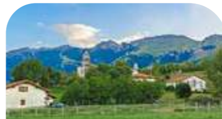
ARAITZ 525 habitantes*

Al abrigo de las impresionantes "Malloas", este valle formado por 6 pueblos, destaca por su verde y pintoresco paisaje, salpicado de antiguos caseríos con escudos nobiliarios. Todo ello envuelto en tradiciones y leyendas vivas en la memoria de sus habitantes.