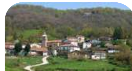
IMOTZ 421 habitantes*

Rodeado de frondosos bosques (especial mención para el de Artikutza), sobresalen los abundantes restos megalíticos (rutas señalizadas), su bello casco histórico, la torre medieval de Ibero (Leitza) y tradiciones enraizadas como el carnaval o la pelota vasca.