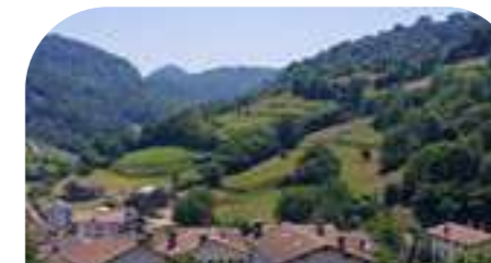
ARESO 267 habitantes*

El valle de Basaburua alberga a 13 pequeños pueblos, rodeados de verdes campos y bosques, que conforman un paisaje tranquilo y hermoso. Robledales y hayedos hacen de este valle un lugar ideal para disfrutar, estar o realizar actividades con la naturaleza.