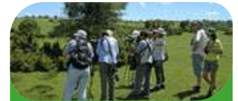
Visitas guiadas MIRUA Lakuntza / 608 560 369 www.mirua.com