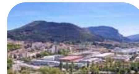
IRURTZUN 2.316 habitantes*

Valle de 8 pueblitos de bella arquitectura tradicional, rodeados de un verde paisaje. Acceso a la vía del Plazaola en Latasa (conexión con la ruta ciclable europea Eurovelo 1), con oferta de restauración, bicis y nordic walking. Producto local y naturaleza.