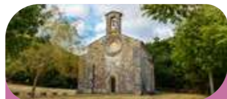
Ermita ITSASPERRI Egiarreta

El patrimonio inmaterial, por otro lado, te dará gratas sorpresas, con manifestaciones que perduran en la memoria local: el deporte rural (herri kirolak) con pelotarís, levantadores/as de piedras (harrijasotzaileak) y cortadores/as de troncos (aizkolariak); o la tradición oral, música y bailes, leyendas y mitología.