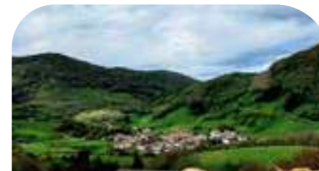
BASABURUA 845 habitantes*

Al abrigo de las impresionantes "Malloas", este valle formado por 6 pueblos, destaca por su verde y pintoresco paisaje, salpicado de antiguos caseríos con escudos nobiliarios. Todo ello envuelto en tradiciones y leyendas vivas en la memoria de sus habitantes.