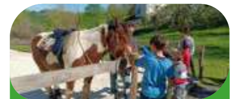
Caballos EQUINOAUKERA Intza / 639 370 645 / www.equinoaukera.com equinoaukera@gmail.com