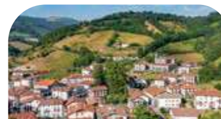
LEITZA 3.010 habitantes*

Este valle se extiende por las faldas de la sierra de Aralar dibujando un hermoso mosaico de bosques, prados, ríos, caminos y pueblitos (16) formados por bellísimos caseríos. Descubre rincones como la cascada de Ixkier, Hiruzubide, o el nacedero del río Larraun.