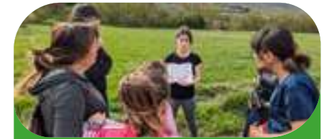
Visitas guiadas AZTI INGURUMEN ZERBITZUAK Bakaiku / 613 096 968 info.aizti@gmail.com