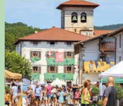
Mercado de Antaño en Lekunberri.