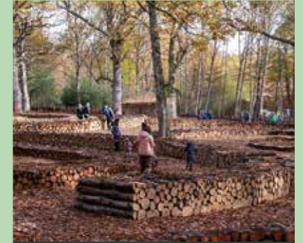
El bosque protector de Jauntsaras-Basaburua.