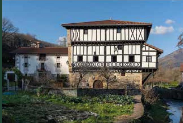
Casa Apeztegiarra de Betelu.