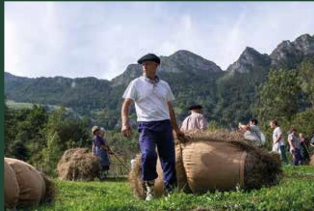
Día del Cable en Gaintza-Araitz.