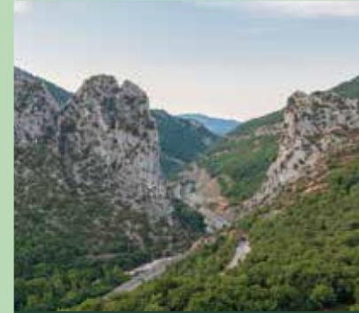
Biaizpek-Dos Hermanas en Iurtzun.