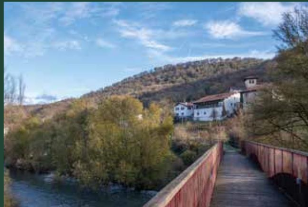
Vía verde Plazaola en Latasa-Imotz.