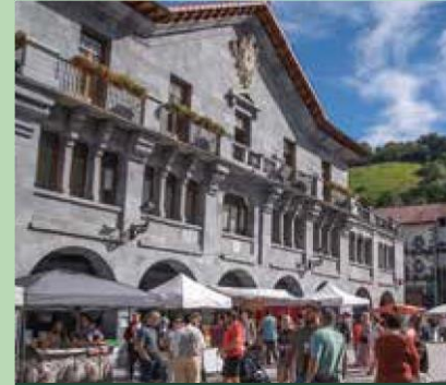
Día del Talo en Leitza.