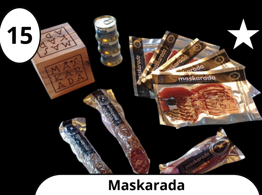
15 Maskarada Euskal txerri produktuak Productos de cerdo Euskaltxerri