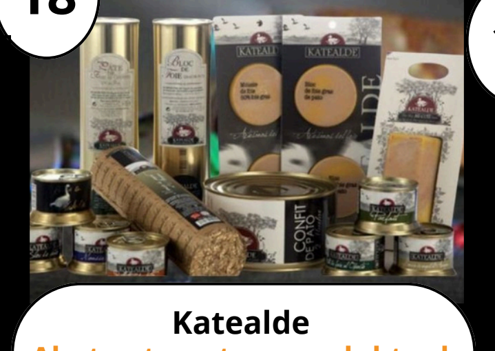
18 Katealde Ahate eta antzar produktuak Productos de pato y oca