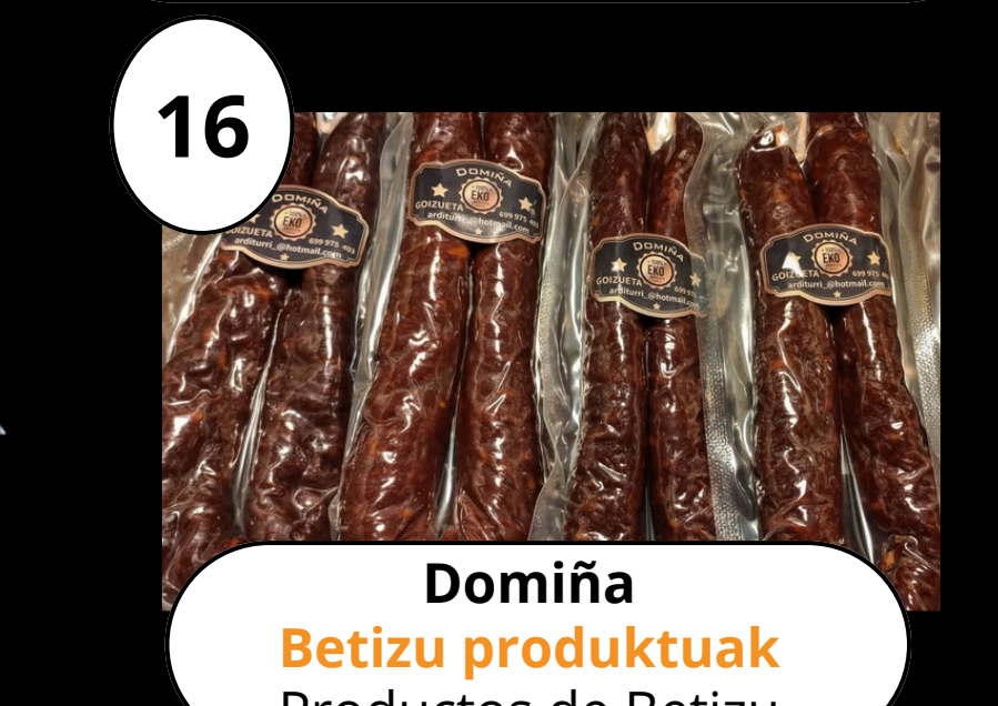
16 Domiña Betizu produktuak Productos de Betizu