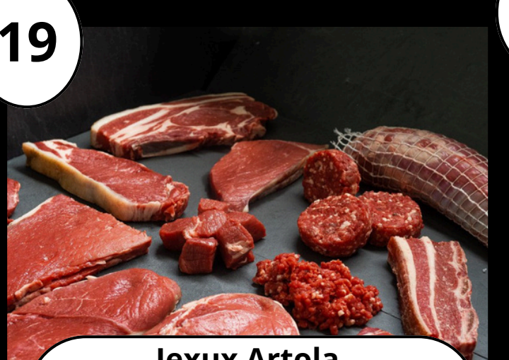
19 Jexux Artola Txekor haragia Carne de ternera