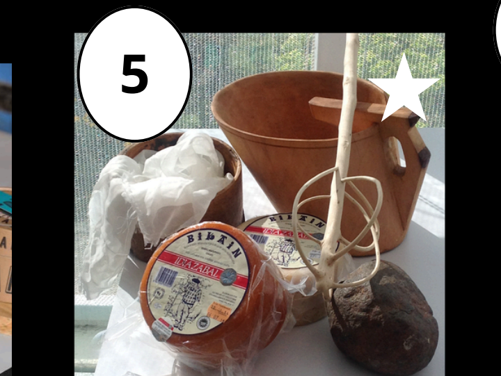
5 Bikain Gaztak Gaztandegia - Quesería