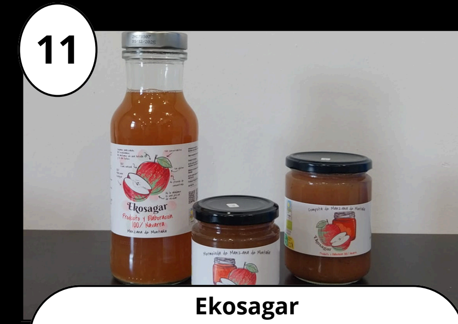
11 Ekosagar Sagar produktuak Productos elaborados con manzana