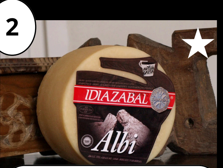
2 Albi Gaztak Gaztandegia - Quesería