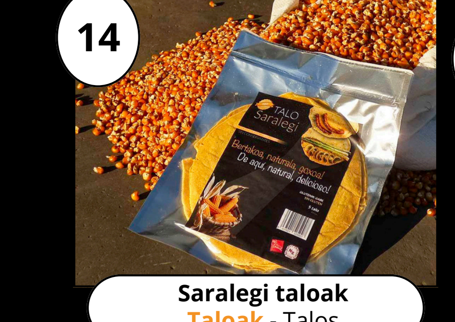
14 Saralegi taloak Taloak - Talos