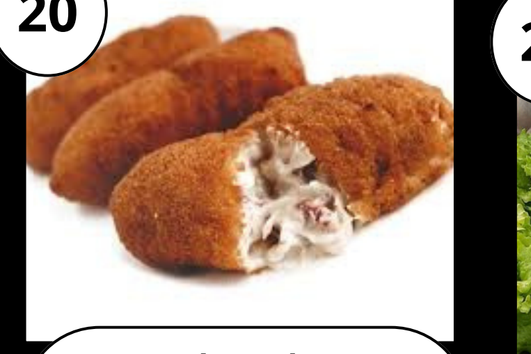
20 Arbeondo Gourmet produktuak Productos gourmet