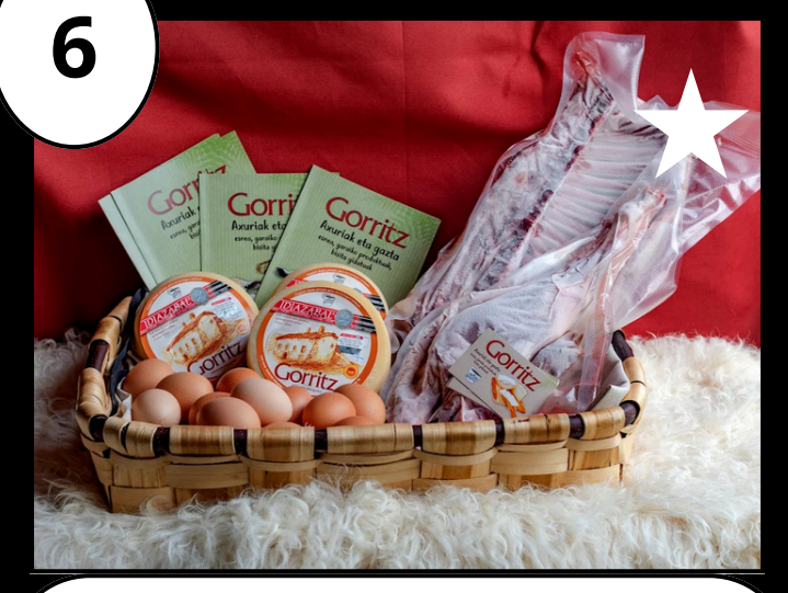
6 Gorritz Gaztandegia - Quesería