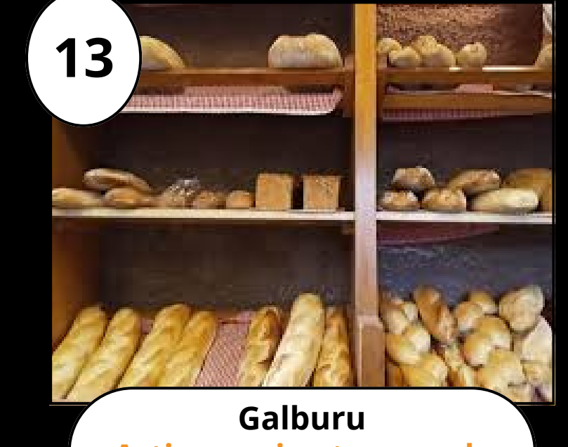
13 Galburu Artisau ogia eta gozoak Pan artesano y dulces