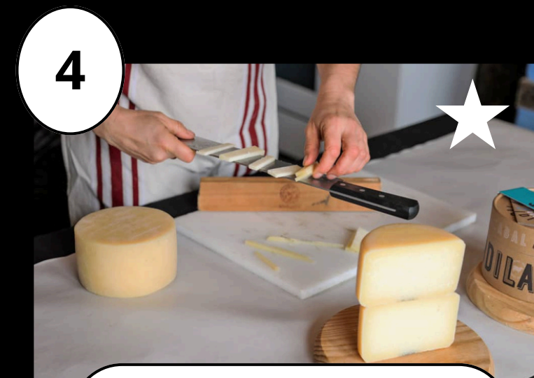
4 Beloki Mendia Gaztandegia - Quesería