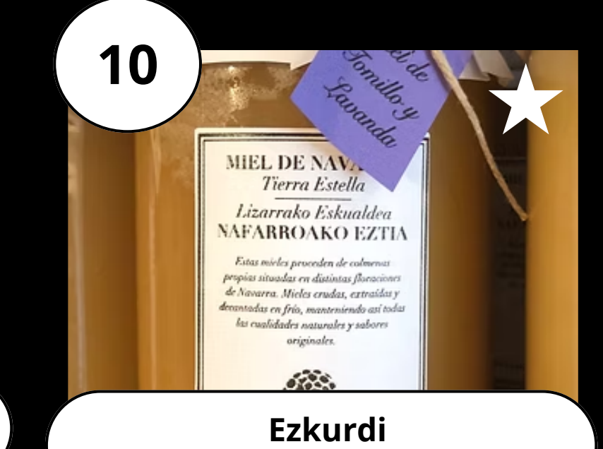
10 Ezkurdi Eztia - Miel