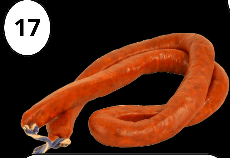
17 Urrutiaenea Hestebeteak - Embutidos