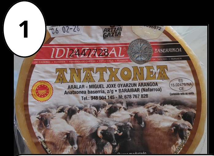
1 Anatxonea Gaztandegia - Quesería