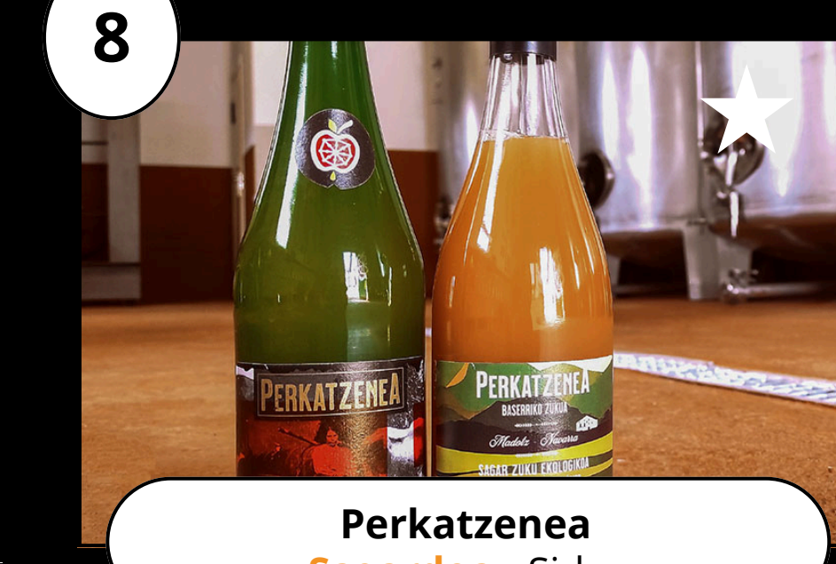
8 Perkatzena Sagardoa - Sidra