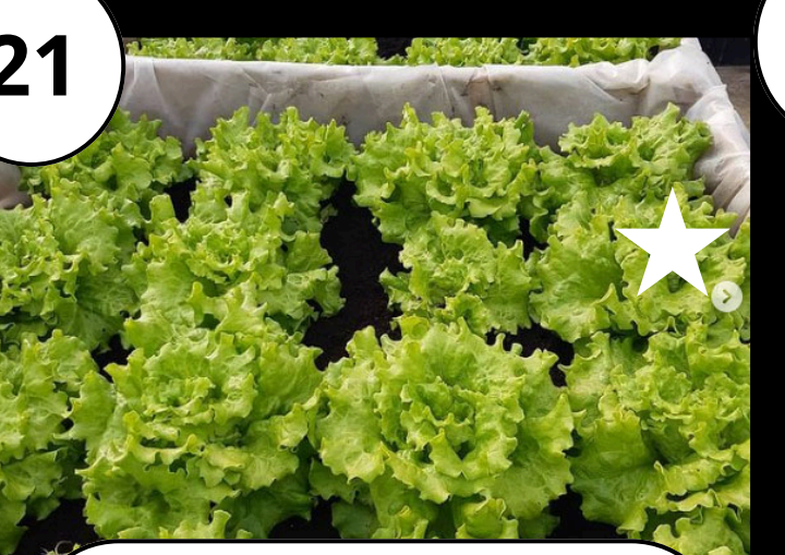
21 Curly Creek Ranch Km0 barazkiak Verduras km 0