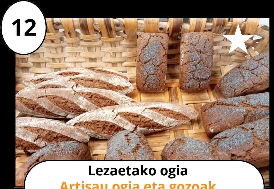
12 Lezaetako ogia Artisau ogia eta gozoak Pan artesano y dulces