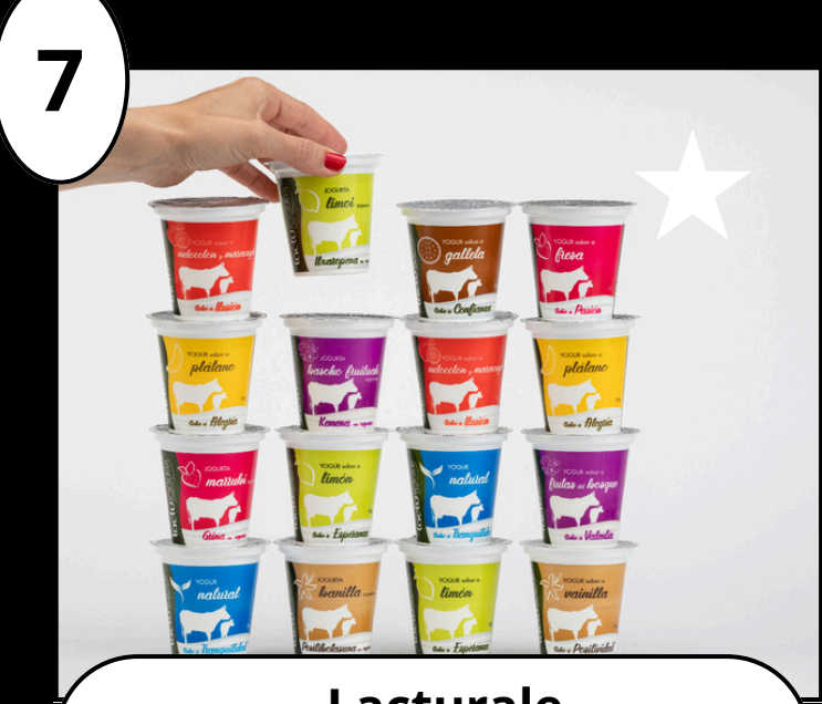
7 Lacturale Esnekiak - Productos lácteos