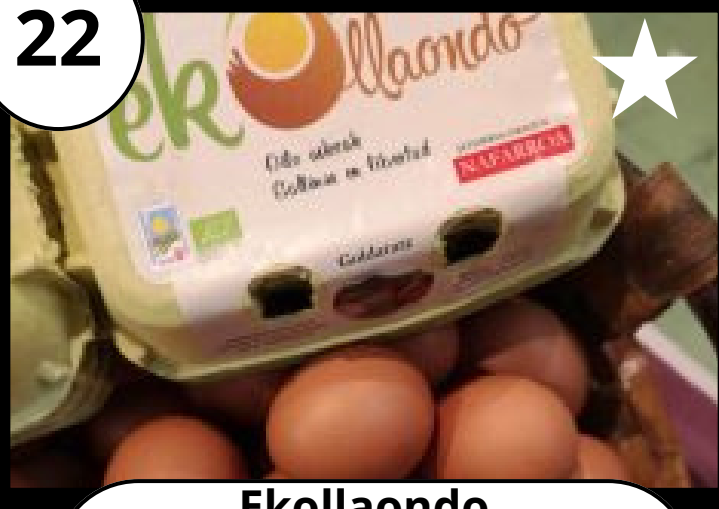
22 Ekollaondo Arrautza ekologikoak Huevos ecológicos