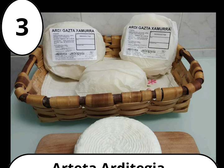
3 Arteta Arditegia Gaztandegia - Quesería